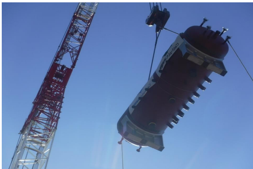
●1工区ボイラドラム吊り上げ搭載状況