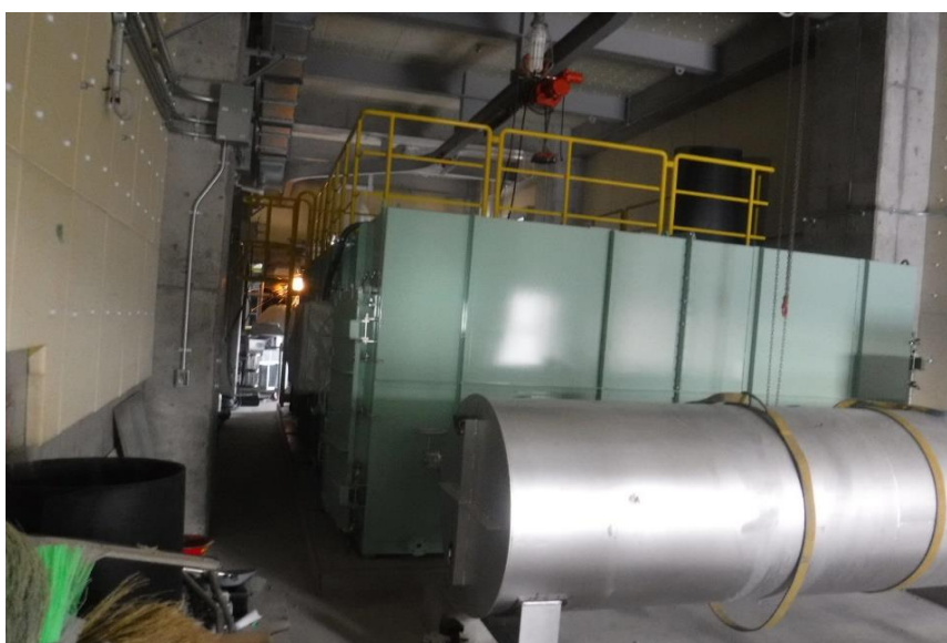
●2工区脱臭装置据付状況