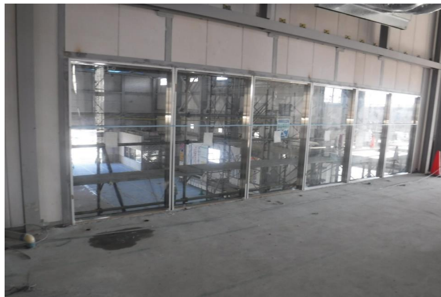
●3工区プラットホーム見学者用ガラス窓設置状況