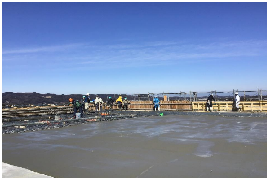
●2工区ごみピット屋根コンクリート打設状況