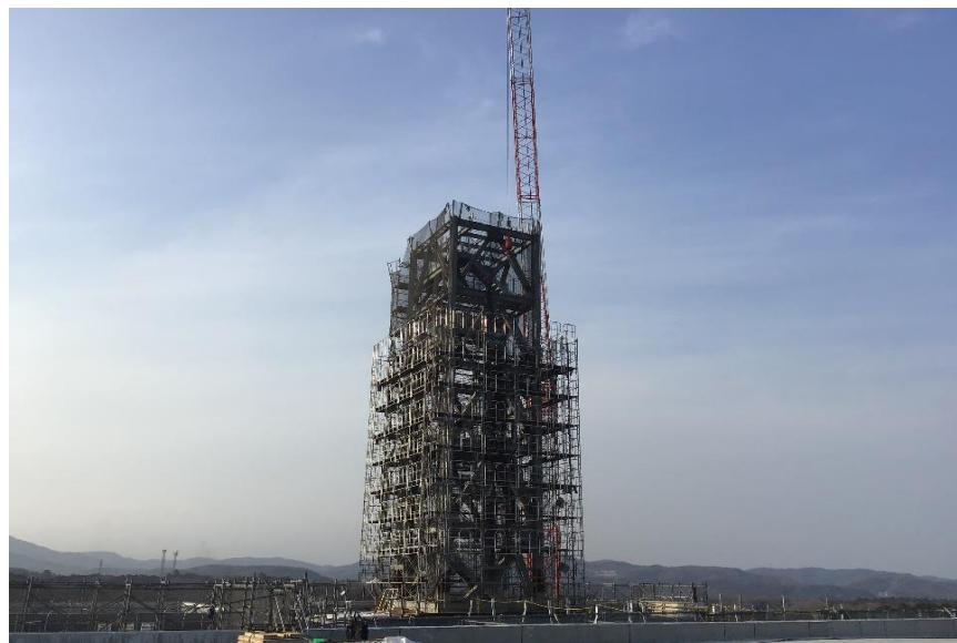
●1工区煙突外部足場組立状況