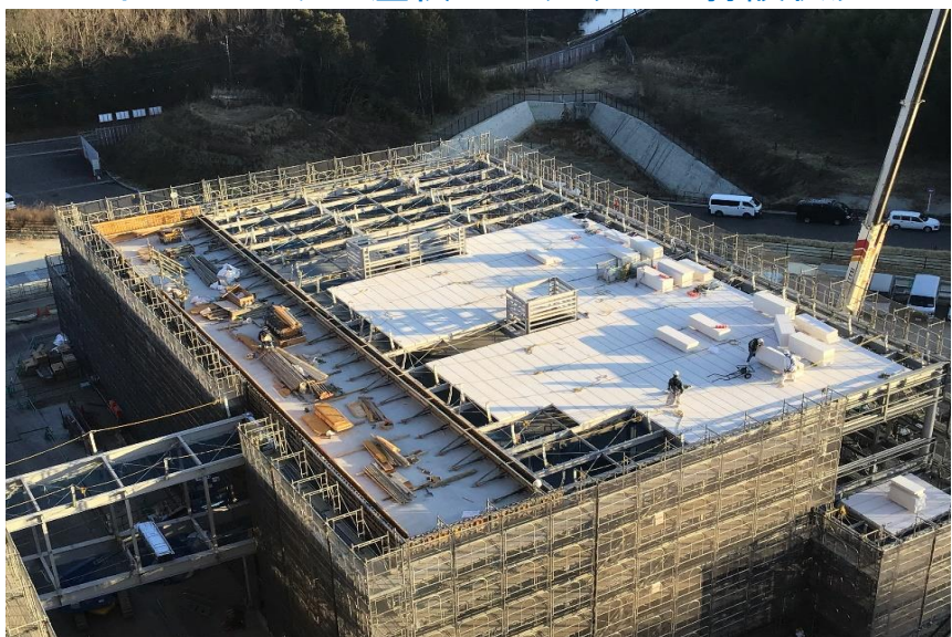
●管理棟ALC屋根施工状況