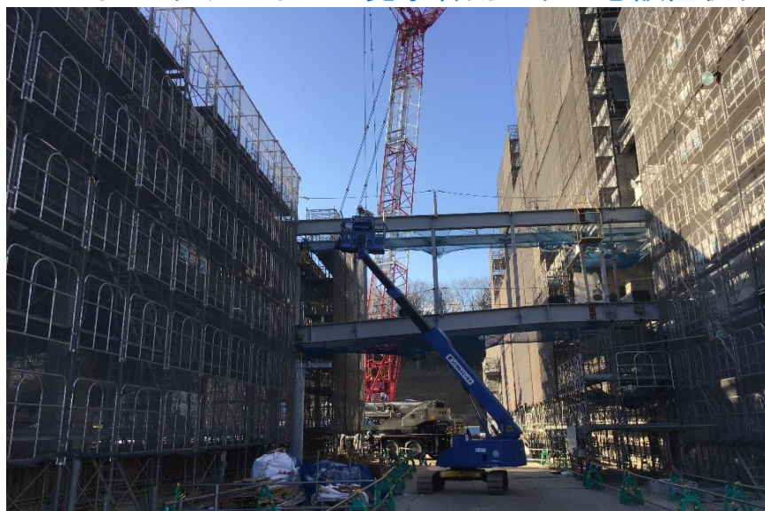
●管理棟～工場棟間渡り廊下鉄骨施工状況