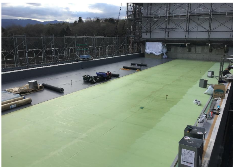
●3工区3階屋根防水施工状況