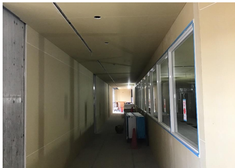
●2工区2階壁天井ボード貼状況