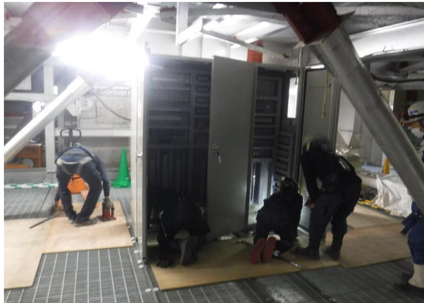
●1工区炉室内制御盤設置作業状況