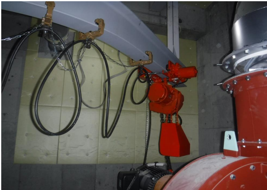
●1工区各所電動ホイスト設置状況