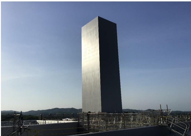
●1工区煙突外部足場解体後状況