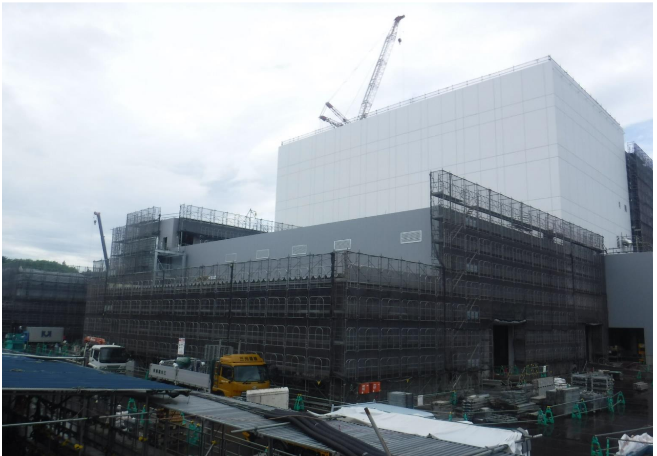
施設北西側より(2022年4月27日現在)