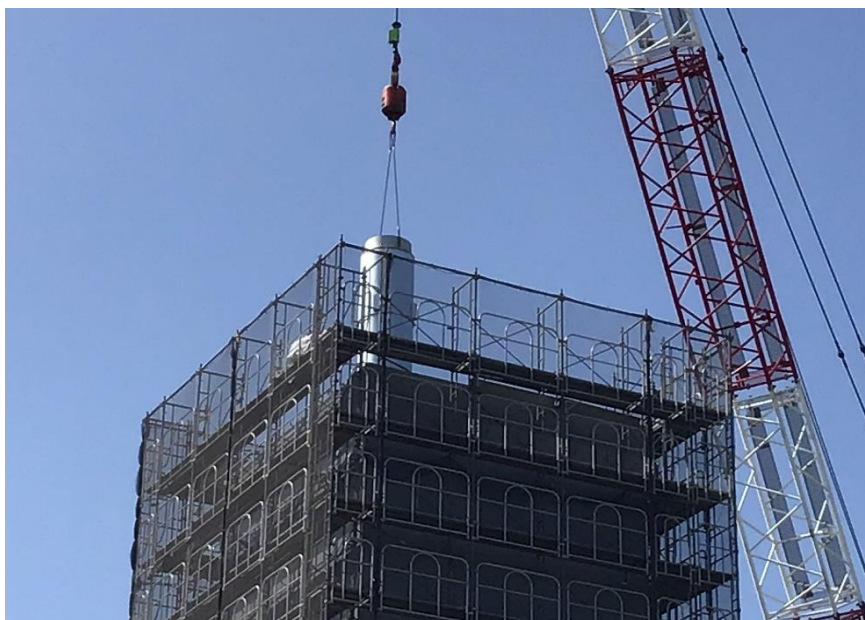
●1工区煙突内筒設置作業状況