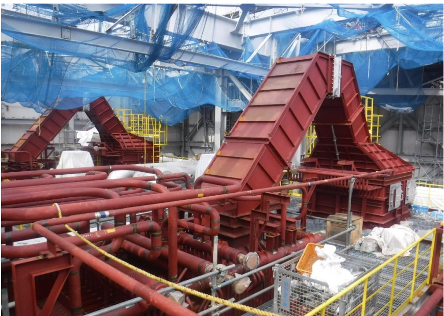
●1工区炉室上層階ボイラ設置状況